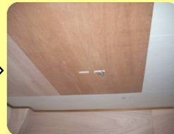
ウレタンボード施工