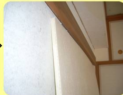
ウレタンボード施工