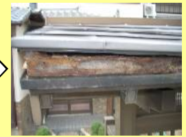
下地劣化により板金が浮いてくる