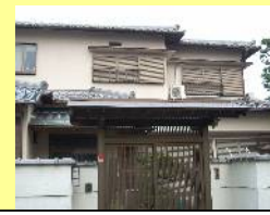
☆屋根材を葺き替え完成