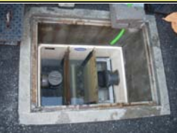
④清掃完了♪綺麗になりました☆☆☆