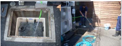
③高圧洗浄機によりトラップ全体及び配管の洗浄を行います