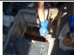
②バスケット(受け籠)を取り出し掃除