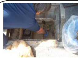
①トラップ内のゴミ等を全体的に取り除きます

右写真は豊中市内に所在する飲食店様にて地中埋設型グリーストラップの清掃業務を行わせて頂いたものです。お店の方がバスケット等に詰まったゴミを日常的に清掃される事を除き、配管の洗浄を含んだグリーストラップ全体の清掃は3ヶ月毎に行うのが目安ですので、是非ご参考下さいませ☆