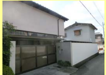
箕面市桜ヶ丘3丁目T様邸 【工事内容】 外構工事・塗装工事・車庫改修