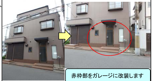
赤枠部をガレージに改装します

所在地:西宮市上ヶ原9番町 地積:169.36㎡(約51.23坪) 現況:古家有 【建築予定建物概要】 構造:木造/スレート葺/2階建 間取り:1K 総戸数:8戸 面積:23~24㎡(予定) 賃料:55,000円~62,000円 (予定)