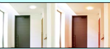
人感センサー付小型シーリングライト

◇2011年に起きた東日本大震災を機に、急激に普及したLED照明。普及に伴い価格も下がり、現在は省エネ性能も向上し、新築・リニューアル共にLED照明の導入がほとんどになっています。