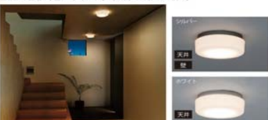
小型シーリングライト設置例